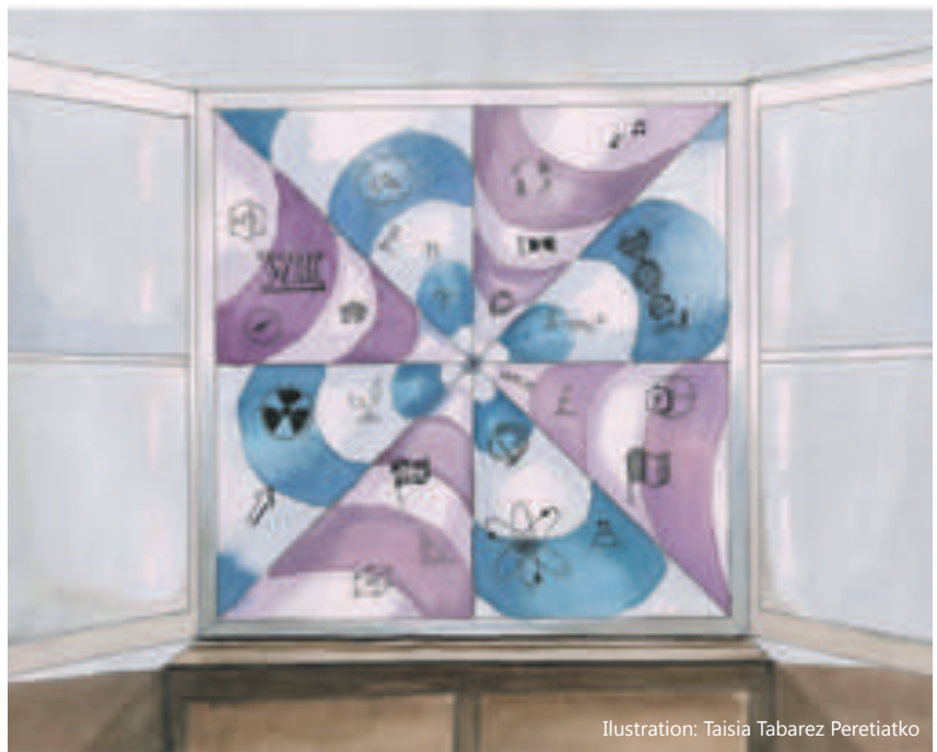
Illustration: Taisia Tabarez Peretiako

Als Gymnasium ermöglichen wir den uns anvertrauten Kindern, die Welt aus verschiedenen Blickwinkeln und mit dem Wissensstand der Gegenwart anzuschauen und zu erkunden. Wir haben uns zur Aufgabe gemacht, eine fundierte Allgemeinbildung zu vermitteln, einen modernen Sprachunterricht anzubieten und einen vertieften naturwissenschaftlichen Schwerpunkt zu setzen.