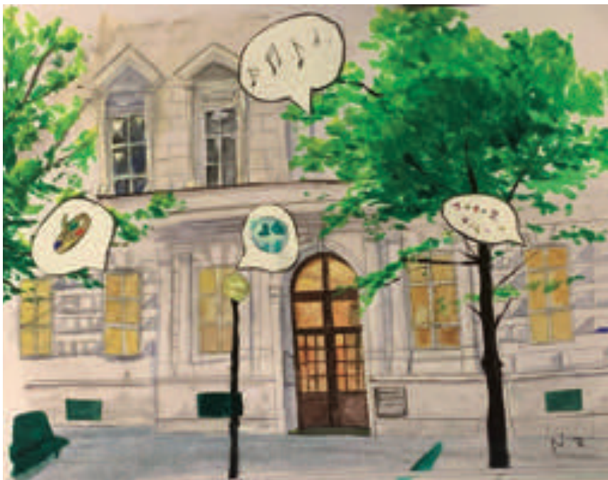
Illustration: Naja Radisavljevic

Die einzelnen Fächer eröffnen unterschiedliche Zugänge zur Wirklichkeit: