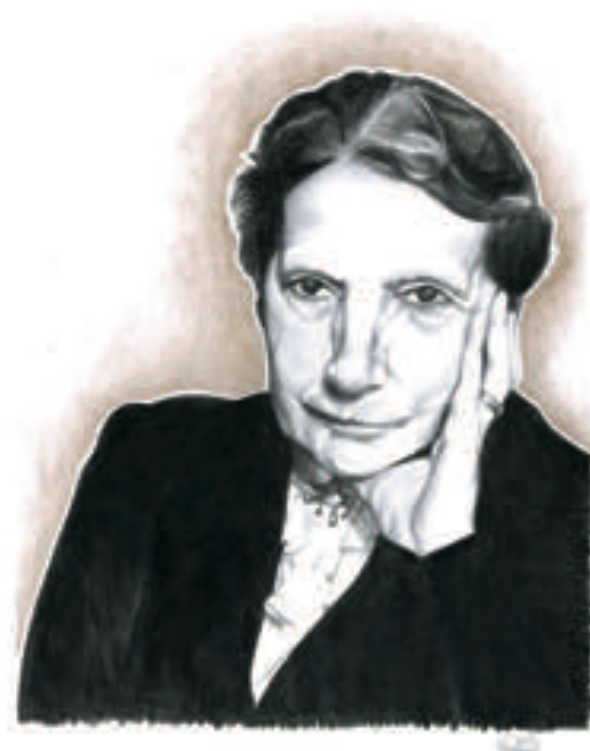
Illustration: Nahnee Park

Gleichzeitig erinnert sie uns an unsere eigene Schulgeschichte, da die Schule im Nationalsozialismus eine jüdische Sammelschule war und diese Schüler*innen von dort vertrieben wurden. Sie ist eine mahnende Stimme, damit die Würde aller Menschen in der Gegenwart und Zukunft gewahrt bleibt und Menschen in Freiheit, Frieden und Sicherheit leben können.